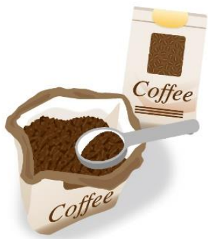
冷凍庫保存の場合、賞味期限は、豆なら1ヶ月、挽いたものは3日～1週間程度といわれています。

保存方法は、冷凍庫が最適。お店に入れてもらった袋は保存にも適したものも多いので、そのまま使用しても良いですし、密閉袋に入れても良いです。空気を抜いて保存することもポイントです。