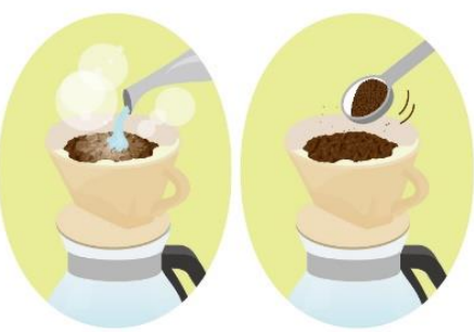
ドリッパの場合、1杯あたり 10～12g、2杯なら 20g 前後、3杯なら 25～30g 前後。お湯は1杯あたり 120～150cc。お好みで調整してください。

て少し置く。理想の温度は95度前後です。⑤…少量のお湯を、真上から粉全体がふくらむようにやさしく注ぎ、20～30秒そのままにして蒸らします。⑥…粉の中心に3回程度に分けてやさしく注ぐ。最後までお湯が落ちきる前にサーバーから外すことで雑味のないコーヒーになります。ちなみに、ペーパーを湯通しすると、コーヒーの油分が通りにくくなり、すっきりした味わいになります。