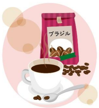
ブラジルとコロンビアはブレンドコーヒーのベースとして使われることが多いです。

● ブルーマウンテン …苦みと甘み、酸味、コクの調和が絶妙。繊細な味わいとやわらかな口あたりで日本人にとっても好まれる品種だそうです。