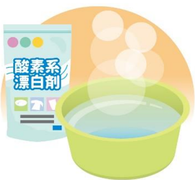
酸素系漂白剤は40度のお湯で効きめを発揮するといわれていますが、分量や湯温は表示を見て使しましょう

浴室は、入浴後にお湯のシャワーで壁や床をしっかりと流しましょう。さらに、スクイージーなどで水気を取れば完璧です。カビは50度以上で