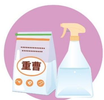
重曹水も菌の繁殖を抑えるので玄関床におすすめ！水 500ml に対して大さじ1の重曹を混ぜれば完成です