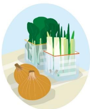
ねぎは青い部分と白い部分を切り分けておくと使いやすいです。

野菜室も見やすくしましょう。ニンジンなどの根菜、ほうれんそうなどの葉物野菜は立てて保存すると長持ちするので、ペットボトルを適当な長さで切り、切り口をテープなど