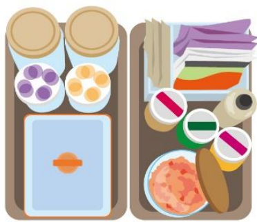
朝食セットはシンプルなトレーにまとめるのもおすすめです♪

ドアポケットはソースやドレッシングのボトルを統一させるとかなりスッキリします。最近では100円ショップでシンプルなボトルや専用のラベルもあるので、おしゃれに整